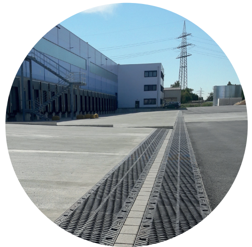
BIRCOpur®: Filtre et absorbe les polluants